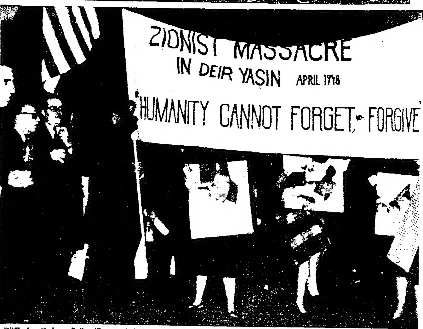
جانب من المسيرة التي اختزلت الشارع الخامس في نيويورك في ذكرى مجزرة دير ياسين في السادس من الشهر الحالي. وقد كتب على اللافتة التي يحملها المتظاهرون عبارة « جريمة الصهيونية في دير ياسين ان تنساها الانسانية ولن تغفرها ».